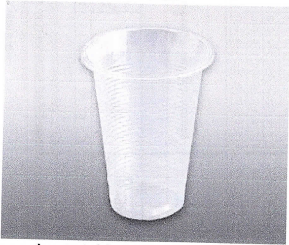
Vasos descartables transparentes 5.5 onz.