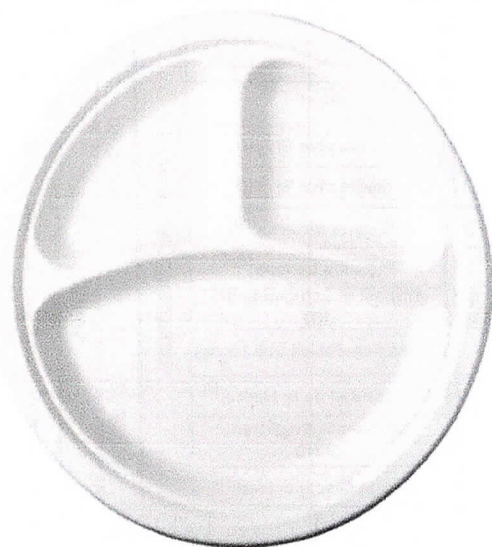
Platos de tecnopor con 3 divisiones