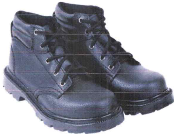
Zapato de seguridad color negro Con punta de acero