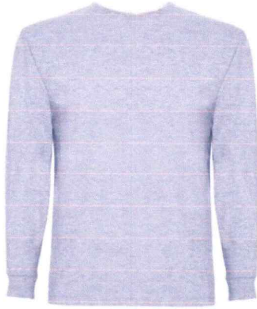
Polo manga larga algodón 20/1 Logo SBH en el pecho Color plomo