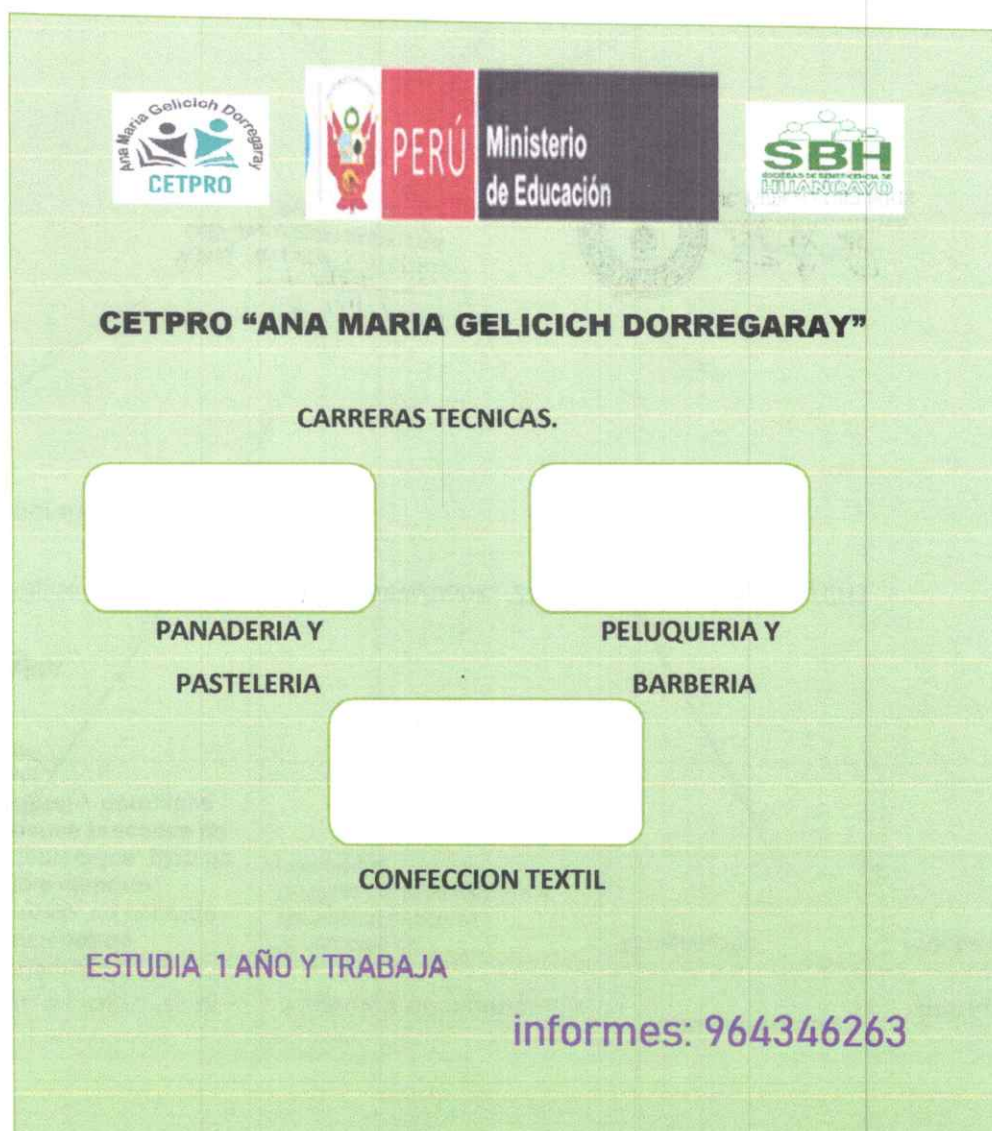
IMAGEN REFERENCIAL ADELANTE