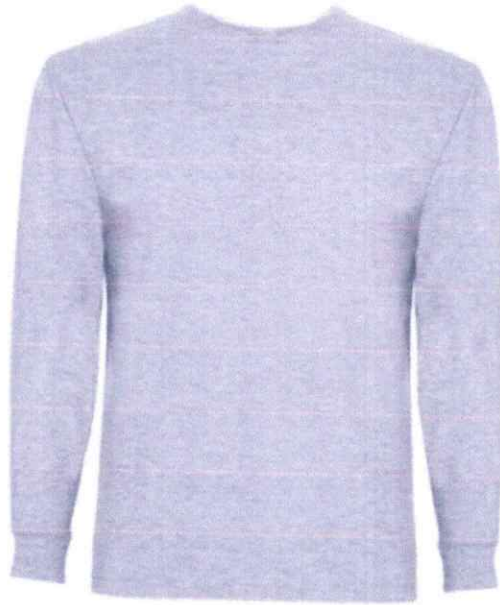
Polo manga larga algodón 20/1 Logo Cementerio en el pecho Color plomo