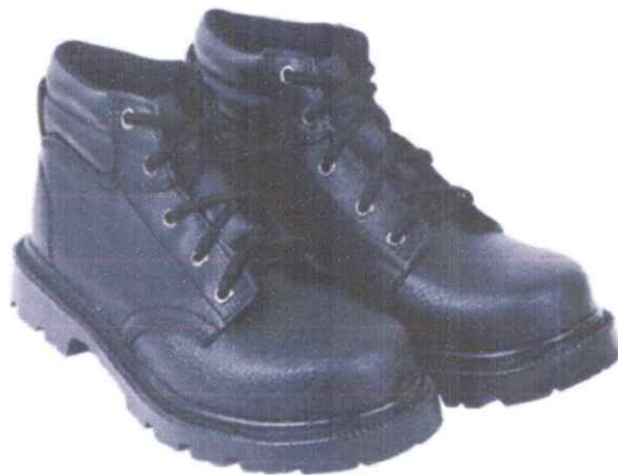
Zapato de seguridad cuero color negro Con punta de acero