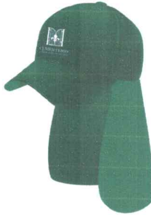
Jockey con protector de nuca Color verde cazador Logo Cementerio en el frente Tela drill tecnología Verde según modelo o similar