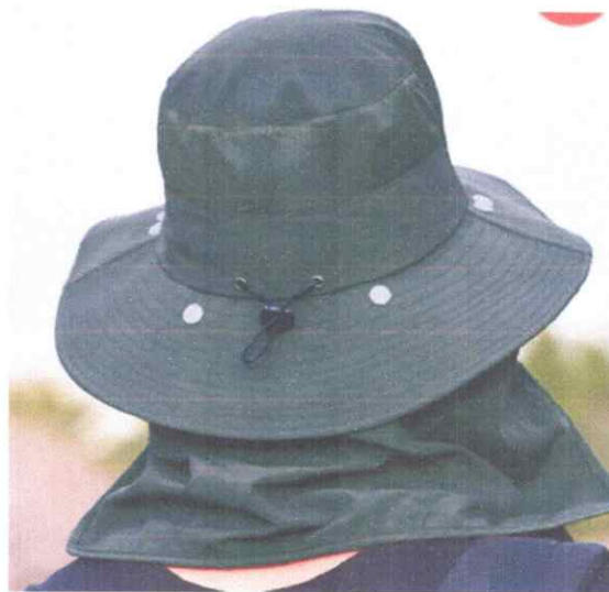
Sombrero zafarí ala ancha Con protector de nuca Color Verde cazador según modelo Tela drill tecnología Logo SBH en el frente Logo Cementerio