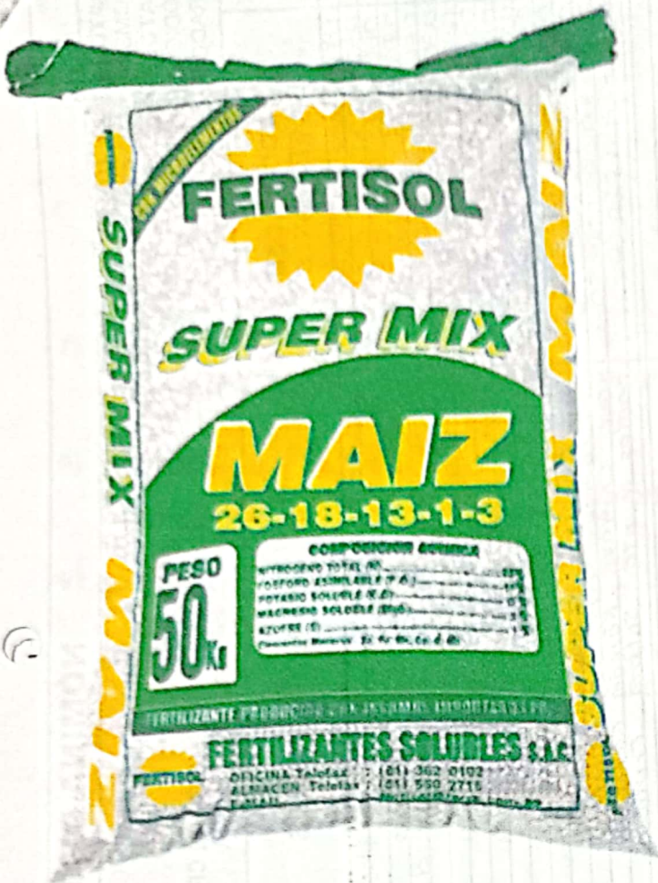
Abono sintético Super Mix Maíz